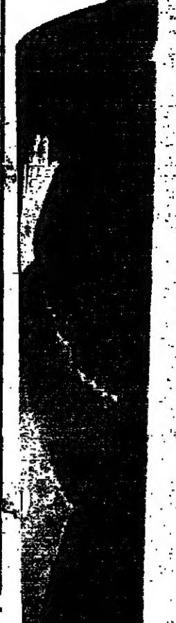
تونس... صربية... في ميدان التحرير... في صربيا...